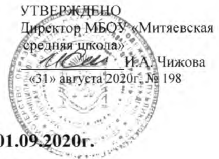
График посещения школьного буфета с 01.09.2020г.