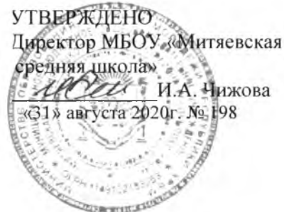
График дежурства учителей в столовой на сентябрь 2020