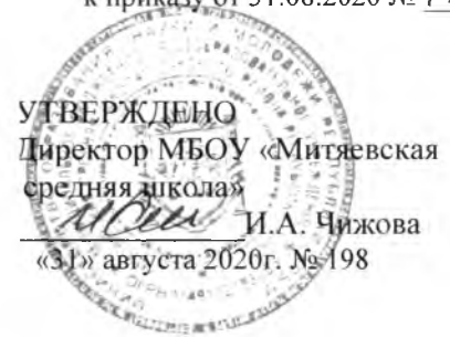
График питания в школьной столовой с 01.09.2020год