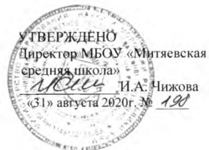
График учебных занятий и перемен