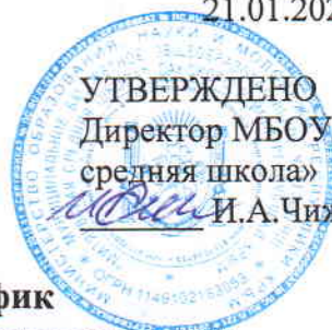
График технической поддержки педагогов МБОУ «Митяевская средняя школа»